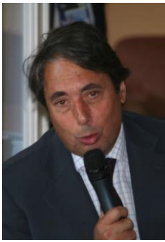
Michel Destot, Député maire de Grenoble, Président de l'AMGVF, Viceprésident de l'AVE