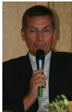
Patrice Calmejane, Député maire De Villemomble (93)