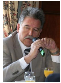
Richard Mallié, Député des Bouches du Rhône 1 er Questeur de l'Assemblée Nationale